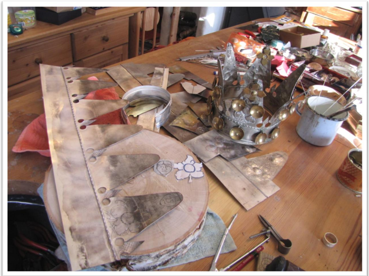
Kopieringsprosessen. Foto: Høvda Sylv ogTre

tenker at arbeidet som er utført på den gamle krona må ha vore utført av ein erfaren sylvsmed, som må ha hatt tilgang på ein god del utstyr.