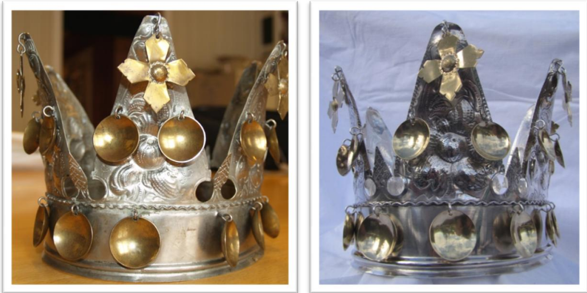
Den gamle og den nye brudekrona

Tradisjonen med bruk av brudekroner byrja som ein katolsk skikk i Noreg og var eit symbol på Jomfru Maria. Etter før reformasjonen i 1537 skifta skikken karakter frå å vere eit katolsk helgensymbol til å vere ein rein bryllaupskikk. Krona skulle berast på utslått hår, og dette var eit teikn på at bruda var jomfru. Her i landet tok bønder og vanleg folk krona i bruk som direkte påverknad frå adelen. Kronene vart eit investeringsobjekt for bøndene som viste at dei hadde sjølvstende, rikdom og makt. Det kunne vere ei eller fleire kroner i kvar bygde, men det var sjeldan mange. Kronene eides av kyrkja eller ein storgardfamilie, som leigde den ut til andre i bygda. Bruk av brudekroner er ein tradisjon som har vore spreidd utover store delar av landet. Tradisjonen gjekk tidleg ut av bruk nokre plassar og heldt seg lenge andre stader, som til dømes i nokre bygder på Vestlandet, kor tradisjonen framleis er levande.