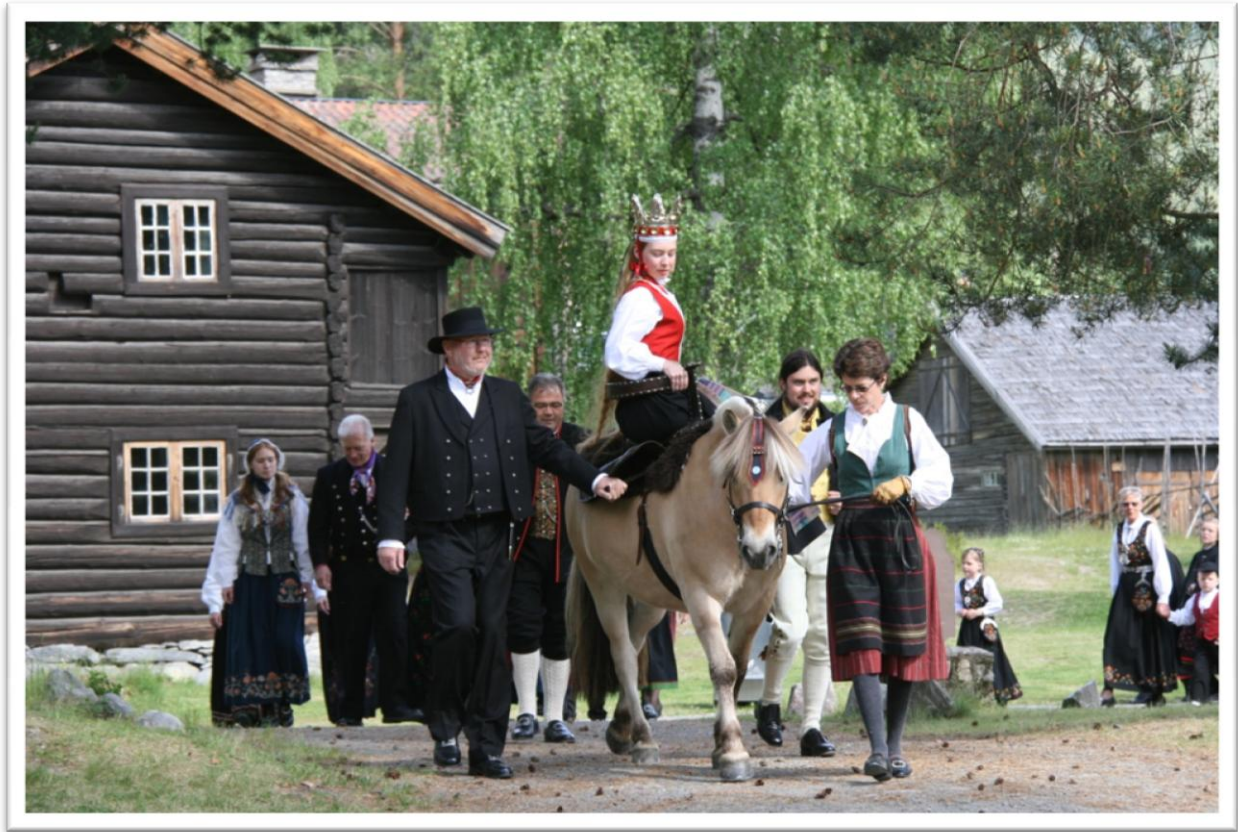
Brudefølge på Lands Museum.

Den gamle krona er no for skjør til å brukast, den vil no verte utstilt på museet slik at publikum kan få sjå den. Den nye krona derimot, er klar for å skape si historie, og brukast til bruder som ynskjer å leie den. Det seiast å vere ei tøff utfordring for ei brud å bære ei slik krone ein heil dag. Den er tung, men den som greier det vil vise seg å vere sterk i nakken. Noko som sikkert er godt å ha som nygift kone.